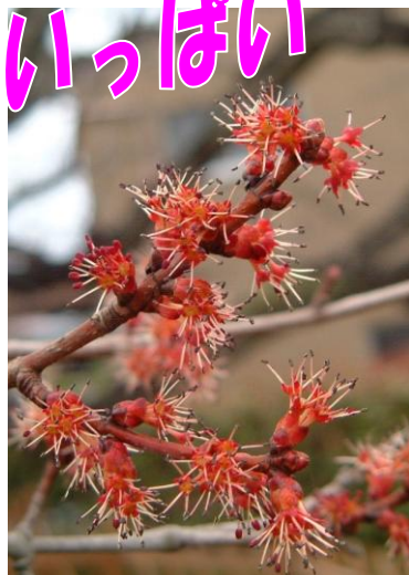
この花は3ページのクイズで