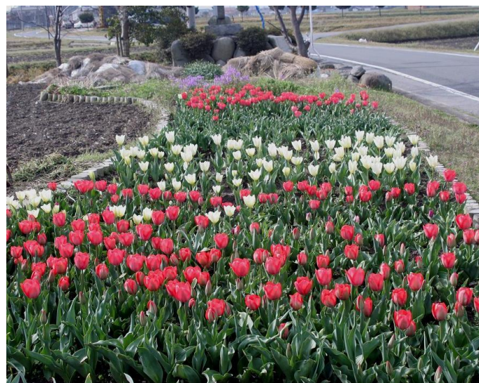
大清水町のチューリップの花壇