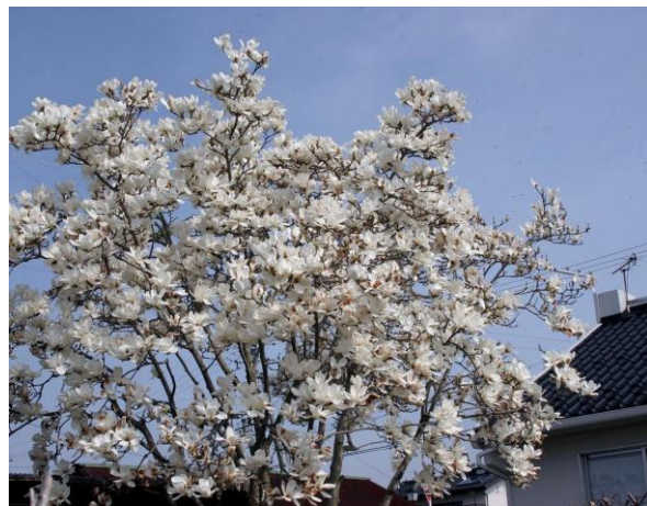
民家の庭で満開のもくれん (横溝出屋敷)