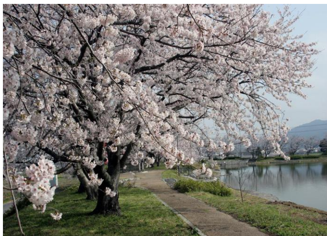
多くの花見客が訪れる八楽溜 (大沢町)