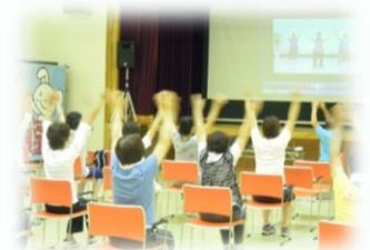
健康体操をする参加者