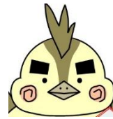
湖東支所 広報担当 ひばりくん