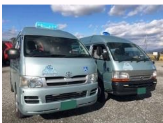
介護タクシー ムラタ 0120-45-2809