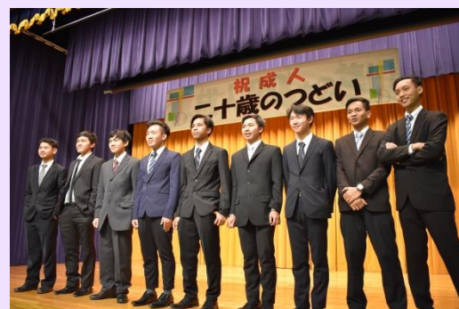
インドネシアの新成人の皆さん