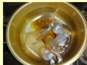
炊飯袋で パエリアを炊く