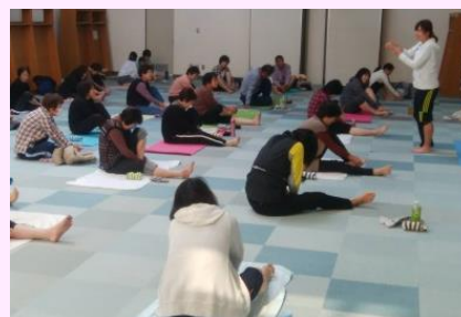
ストレッチ教室の様子