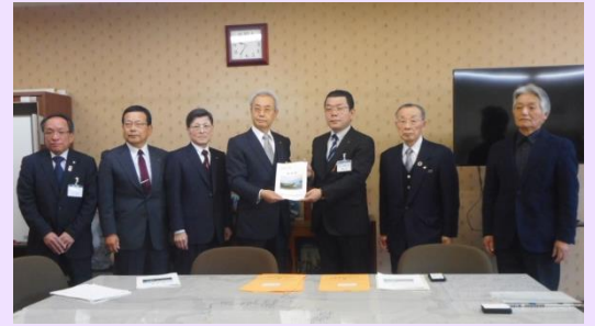
副知事に陳情書を手渡す連絡会会長

また、2月14日には、県土木事務所及び県副知事に陳情に行き、工事の早期具体化、着工を求めてきました。