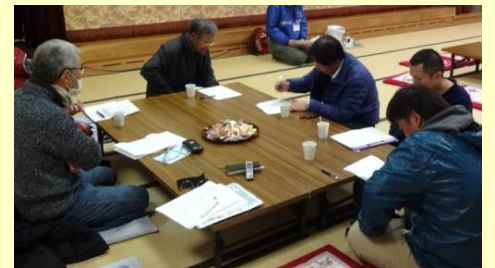
湖東の安全を守るのだ！