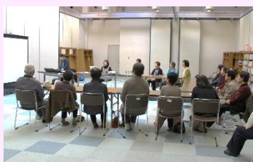
うたごえ喫茶の様子