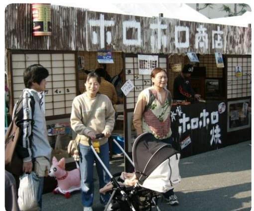
懐かしい昭和の時代風景が出現！

11月3日、ことうふるさとまつりが、開催されました。当日は、お天気にも恵まれ、訪れた皆さんは、秋の一日を満喫されたようでした。